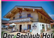
Der Seelaub Hof

Zamenhofweg 5 • Rottach-Weißbach • Tel. 080 22-8 59 79 15