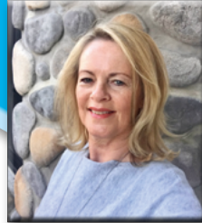
Anzeigenagentur Ida Schmid

Wenn Sie unsicher sind, kontaktieren Sie mich.