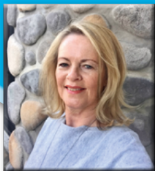
Anzeigenagentur Ida Schmid

Wenn Sie unsicher sind, kontaktieren Sie mich.