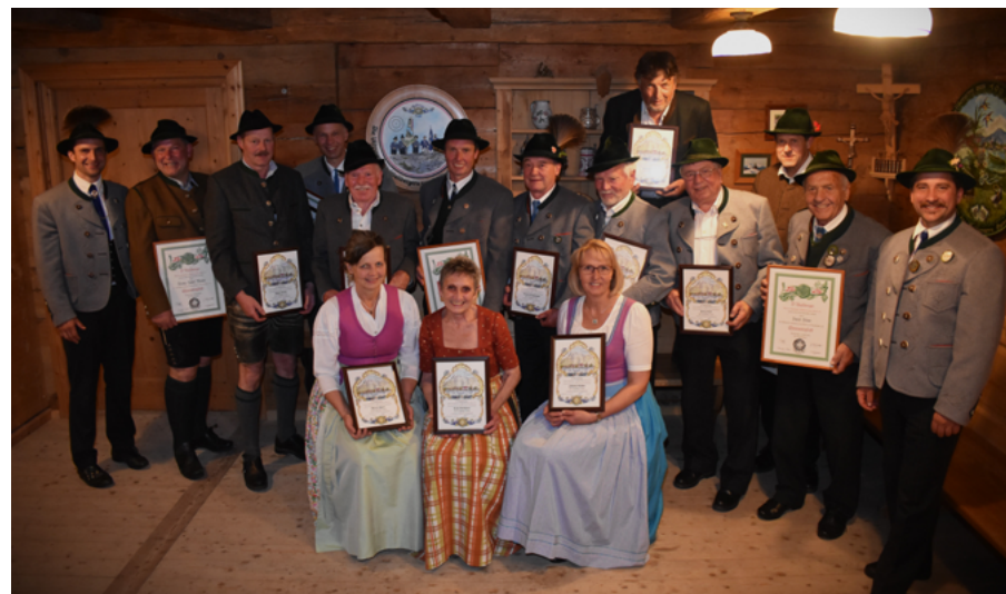
Die anwesenden geehrten Mitglieder (in Klammern die Vereinsangehörigkeit in Jahren) mit den zwei Vorständen: